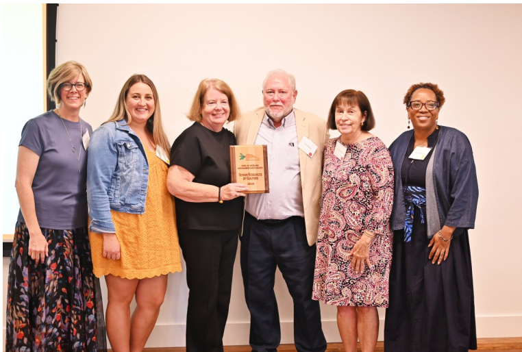
Premio Carl W. Vierling Groundbreaker RECURSOS PARA ADULTOS MAYORES DE GUILFORD